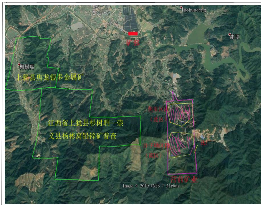
图 1-2 采矿权周边矿权位置图